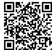
道德熱線 QR 代碼

我們鼓勵您每當有疑慮時就提問並 尋求協助 。即使您不確定是否發生有問題的狀況，也請直言提報。您有幾種提報管道可以選擇：您的主管、人力資源部、法務辦公室、企業法規遵循團隊或 商業行為及道德熱線 (道德熱線)。